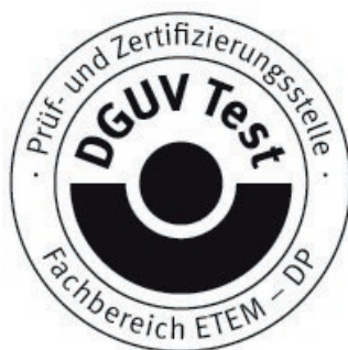
Signature (Dipl.-Ing. Vogl)

Further provisions concerning the validity, the extension of the validity and other conditions are laid down in the Rules of Procedure for Testing and Certification of August 2012.