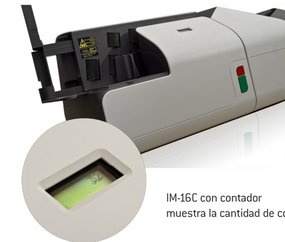
IM-16C con contador muestra la cantidad de correo entrante

Con su método de apertura innovador, la IM-16 elimina desperdicios sin dejar restos de papel por toda la oficina. Su tamaño compacto facilita su ubicación en la oficina, también facilita su desplazamiento y almacenaje.